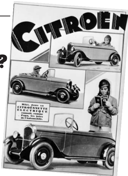
Miki, dans sa Citroënnette électrique, peut évidemment se passer de ceintures de sécurité...

- En l'absence de ceintures de sécurité, les sièges bébés ne sont pas obligatoires et l'enfant voyage sans être attaché. C'est dans ce cas qu'il faut savoir dépasser les prescriptions légales, et installer des ancrages lorsque la configuration de l'auto le permet.