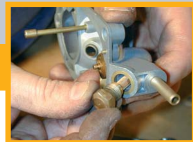
Une bonne alimentation en essence nécessite un carburateur propre. Ici, démontage du filtre à essence.

10 - Ajustage bouché. Au même titre que les gicleurs d'essence, il se peut que les ajustages d'air soient colmatés. Procédez comme ci-dessus. Et si vous disposez d'une bombe de nettoyant carburateur, n'hésitez pas à l'utiliser.